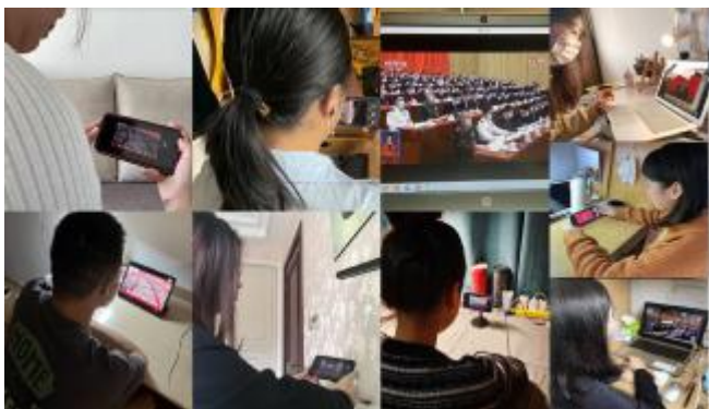
法学院师生通过各种方式收听收看党的二十大精神开幕会