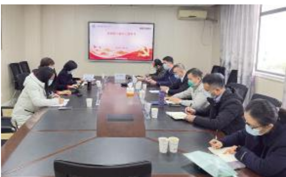
法学院党委举行学习党的二十大精神二级中心组专题学习