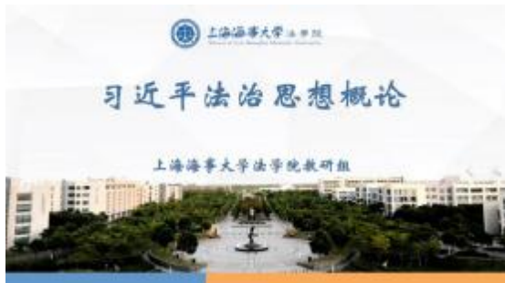
《习近平法治思想概论》课程PPT