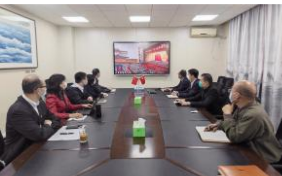
法学院党政联席会成员集中收看党的二十大精神开幕会直播