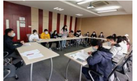
图6 学生党支部组织党的二十大精神学习活动

党的二十大胜利召开以来,交通运输学院(以下简称“学院”)提前启动,积极响应,认真组织,突出重点、抓住关键,把学习宣传贯彻党的二十大精神作为首要政治任务,结合学院实际,多形式组织开展学习宣传活动,掀起了学习党的二十大精神热潮。