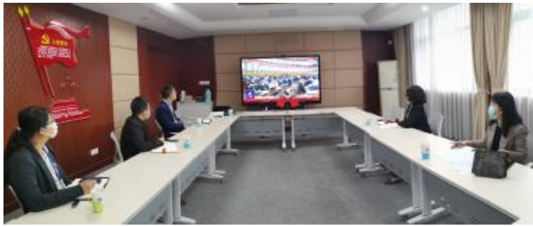
图1 交运班子成员集体观看党的二十大精神开幕会