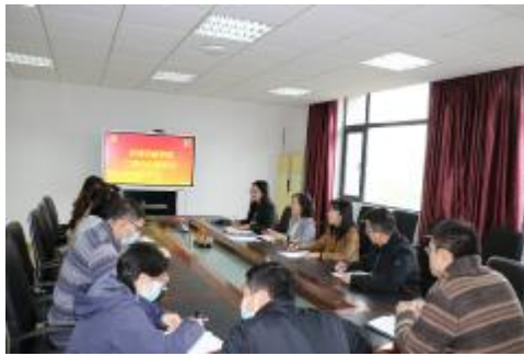
图2 二级中心组开展党的二十大精神学习