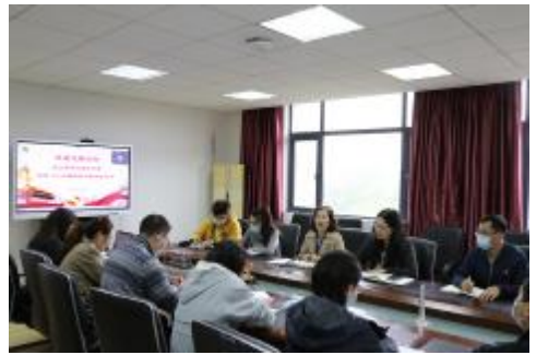
图3 党支部书记培训会暨党的二十大精神学习集体备课会