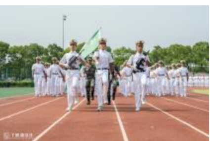
信息工程学院方阵