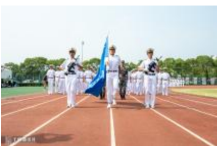
海洋科学与工程学院方阵