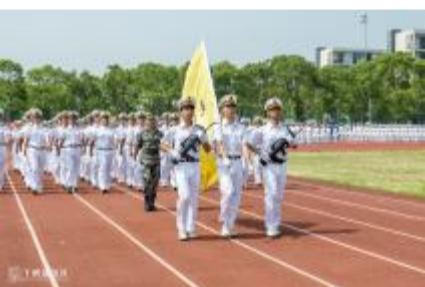
交通运输学院方阵