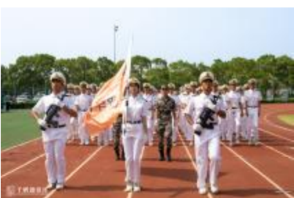
物流工程学院方阵