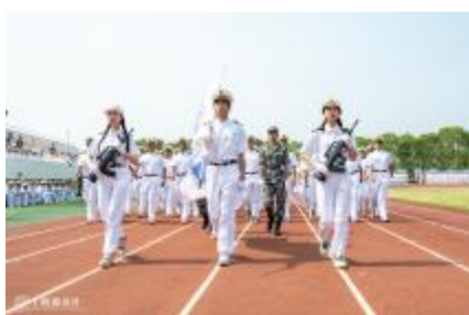
经济管理学院方阵