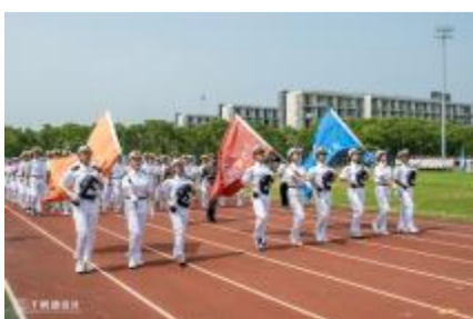
理学院、马克思主义学院和徐悲鸿艺术学院方阵